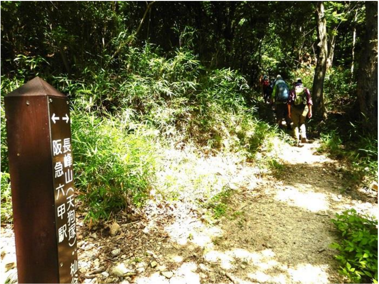
3, 登山道発見しそれを辿る