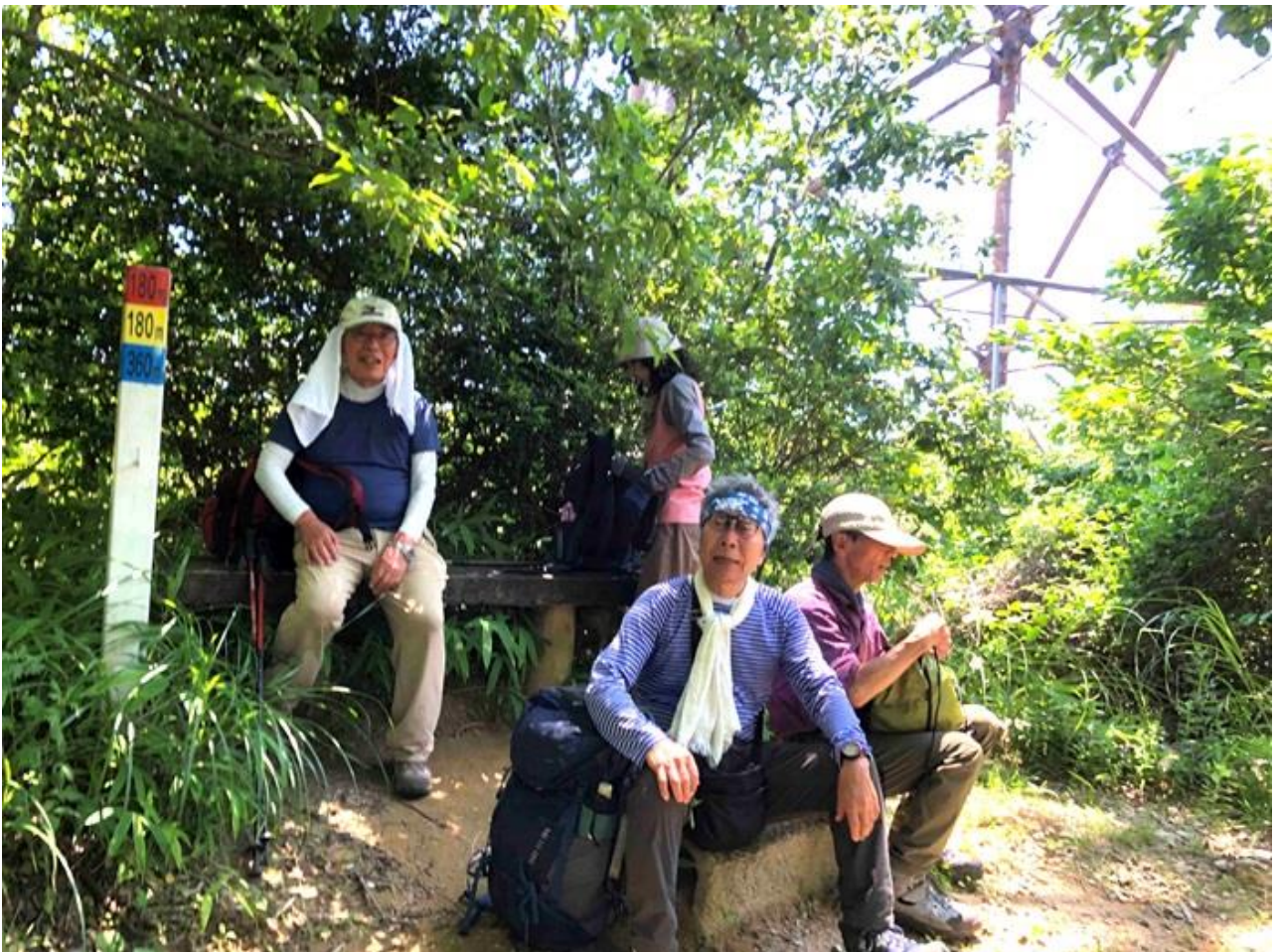
14, 鞍部から上り返し、小休止