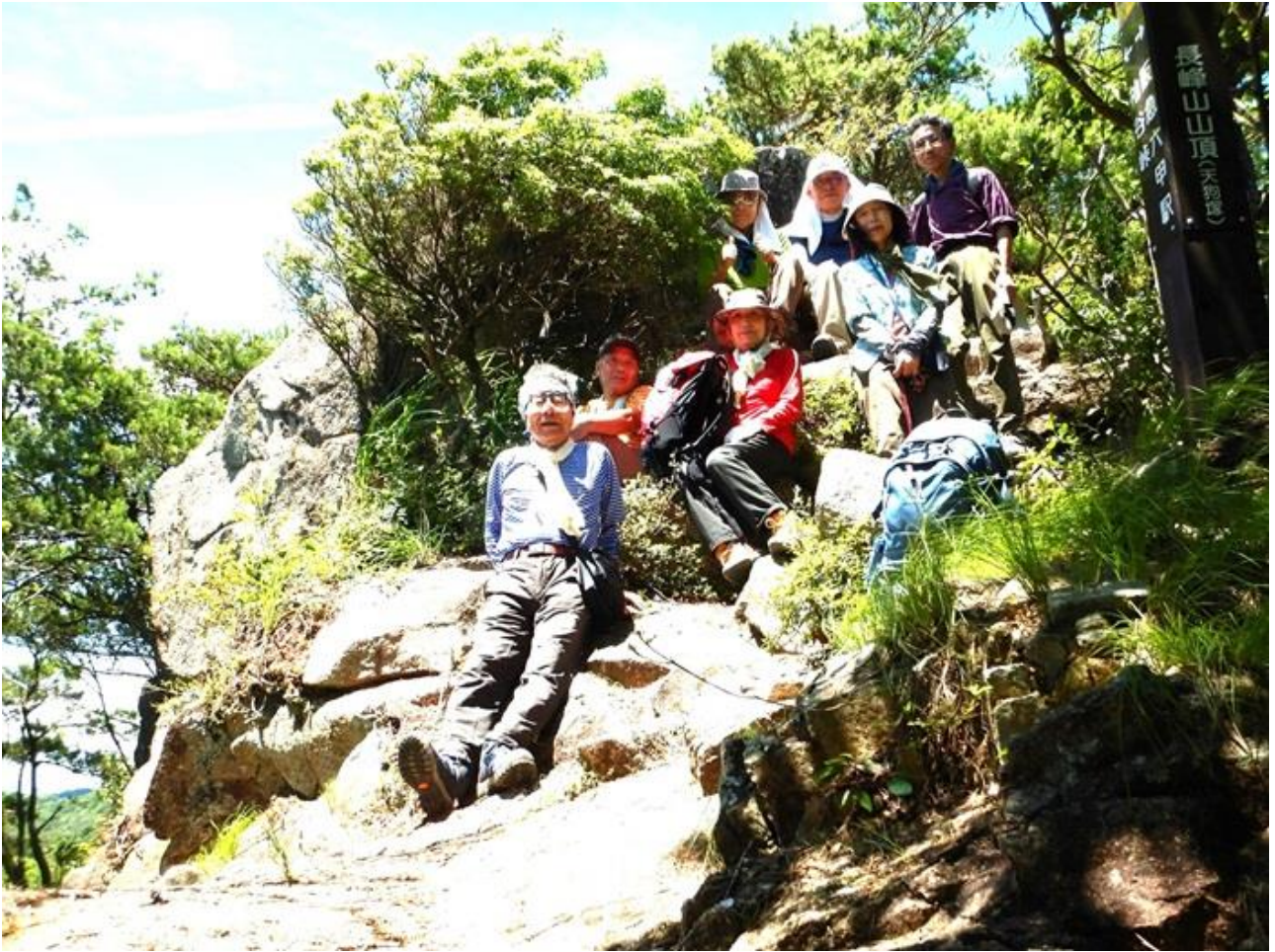
11, 天狗塚の下で全員