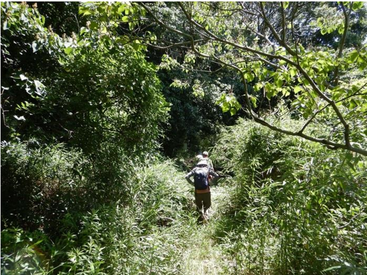
2, 山道に入り登山道を探す