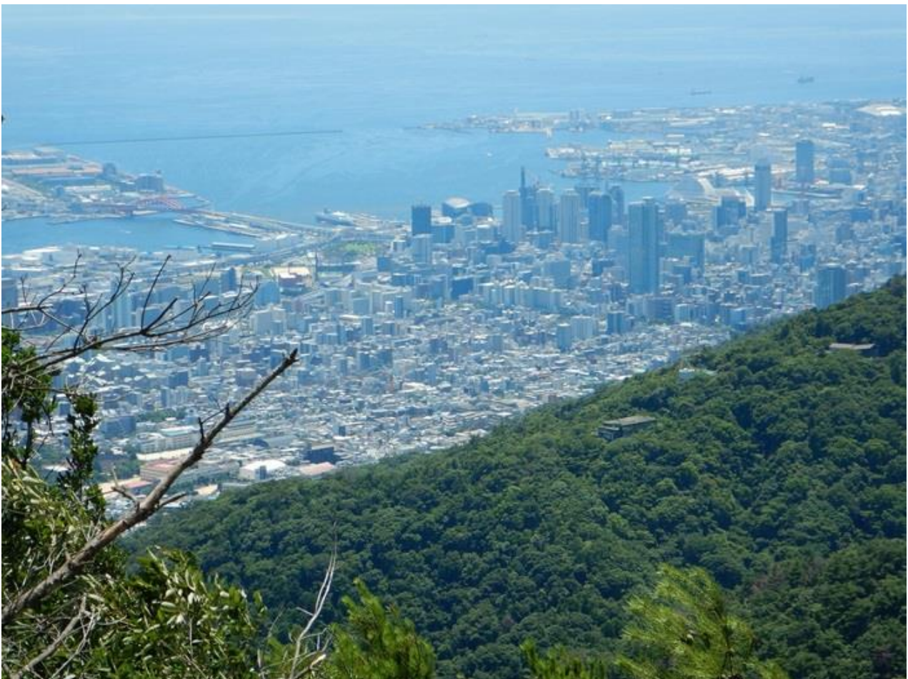
10, 天狗塚から神戸方面をズームアップ