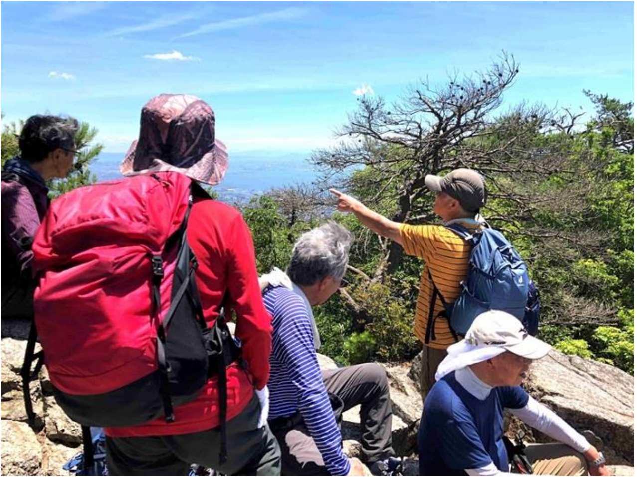
7, 天狗塚から景色を楽しむ