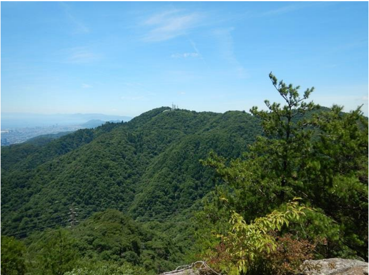
8, 目の前に掬星台、摩耶山が見える