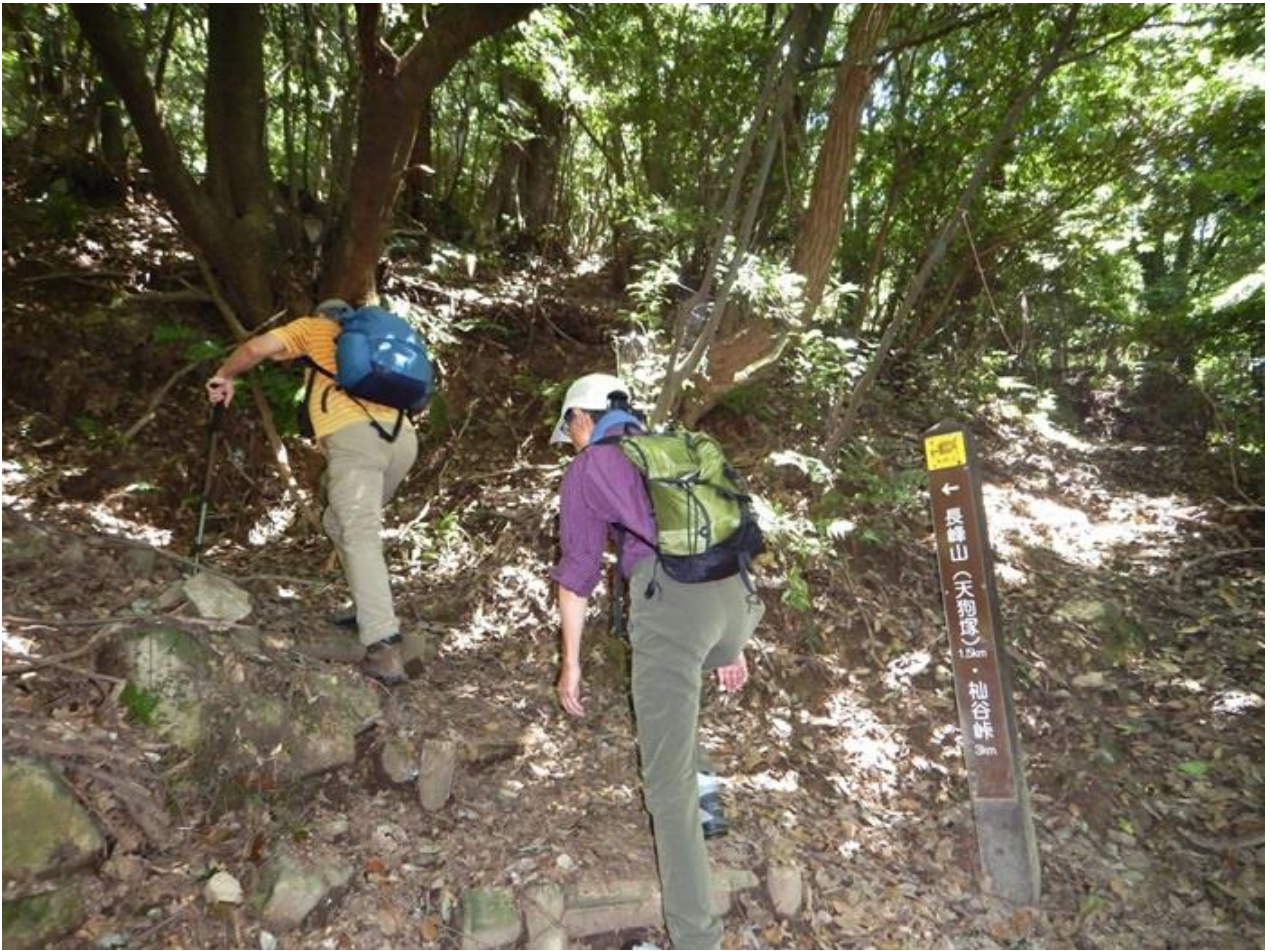
5, 天狗塚まで 1.5Km の標識を通過