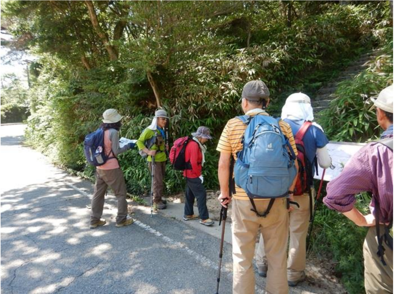
15, 舗装道から丁ヶ辻目指して上り開始