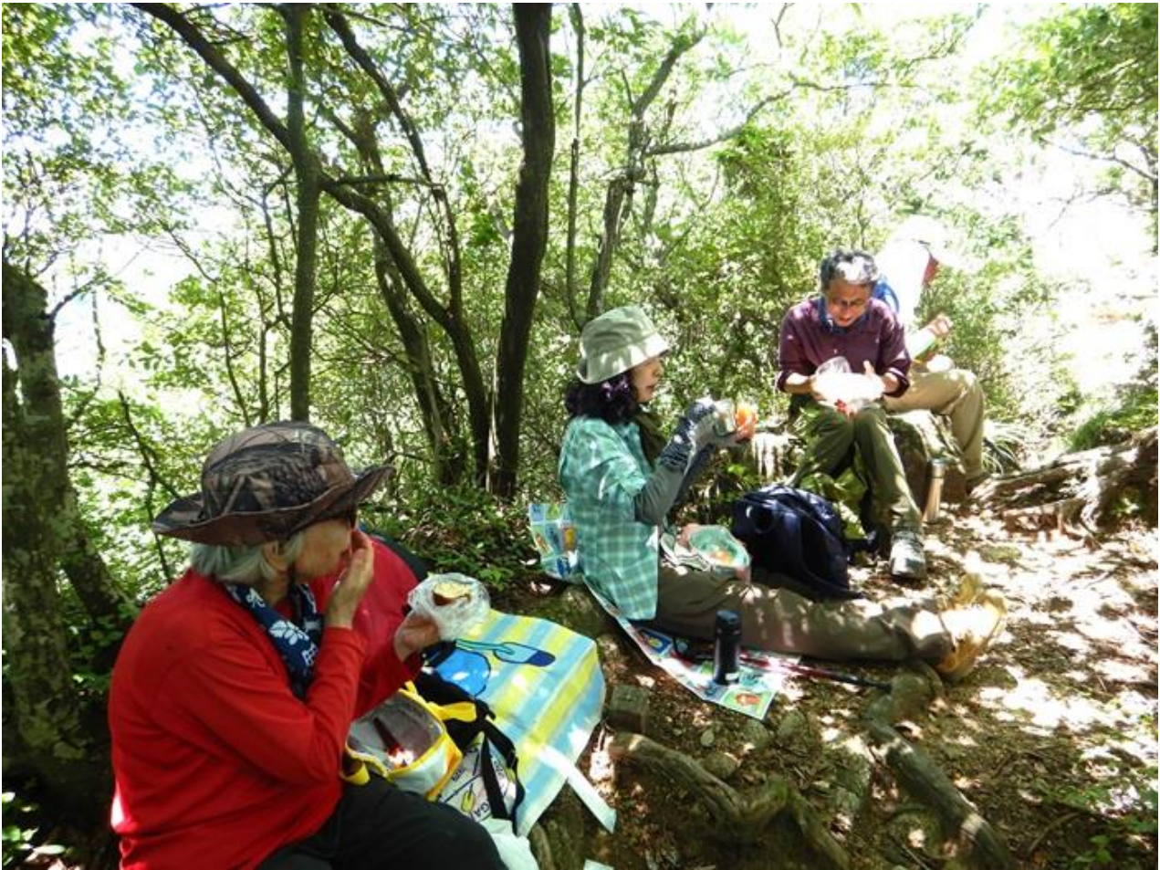
9, 天狗塚から下り、木陰でお弁当