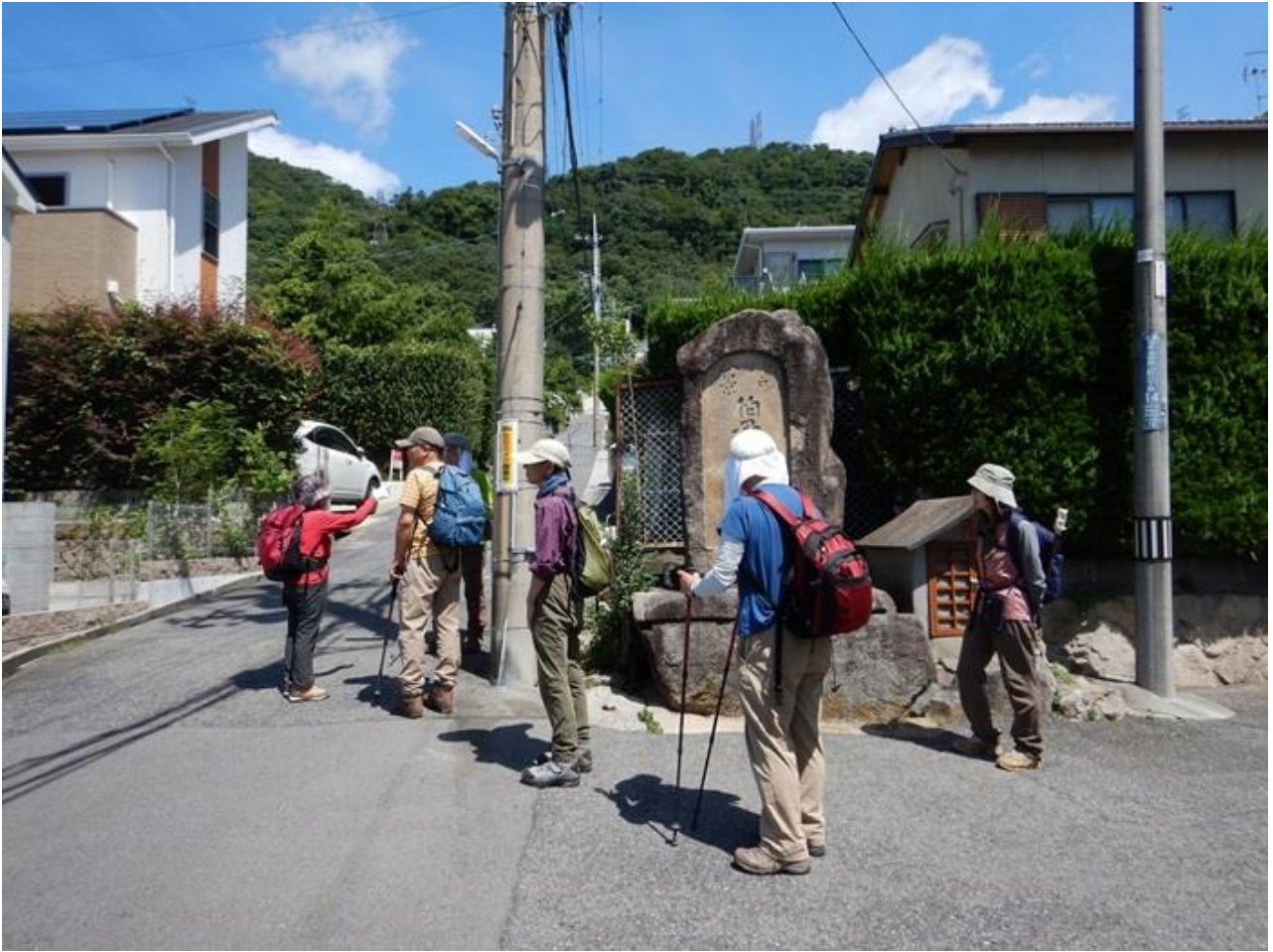
1, 伯母野山住宅碑までタクシー利用