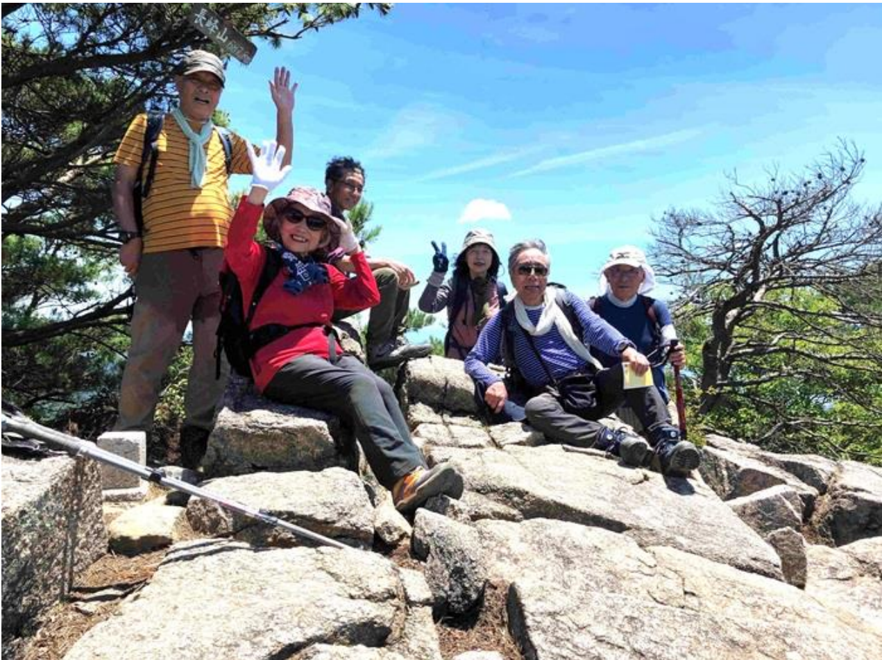
6, 長峰山山頂の天狗塚の岩を上まで上る