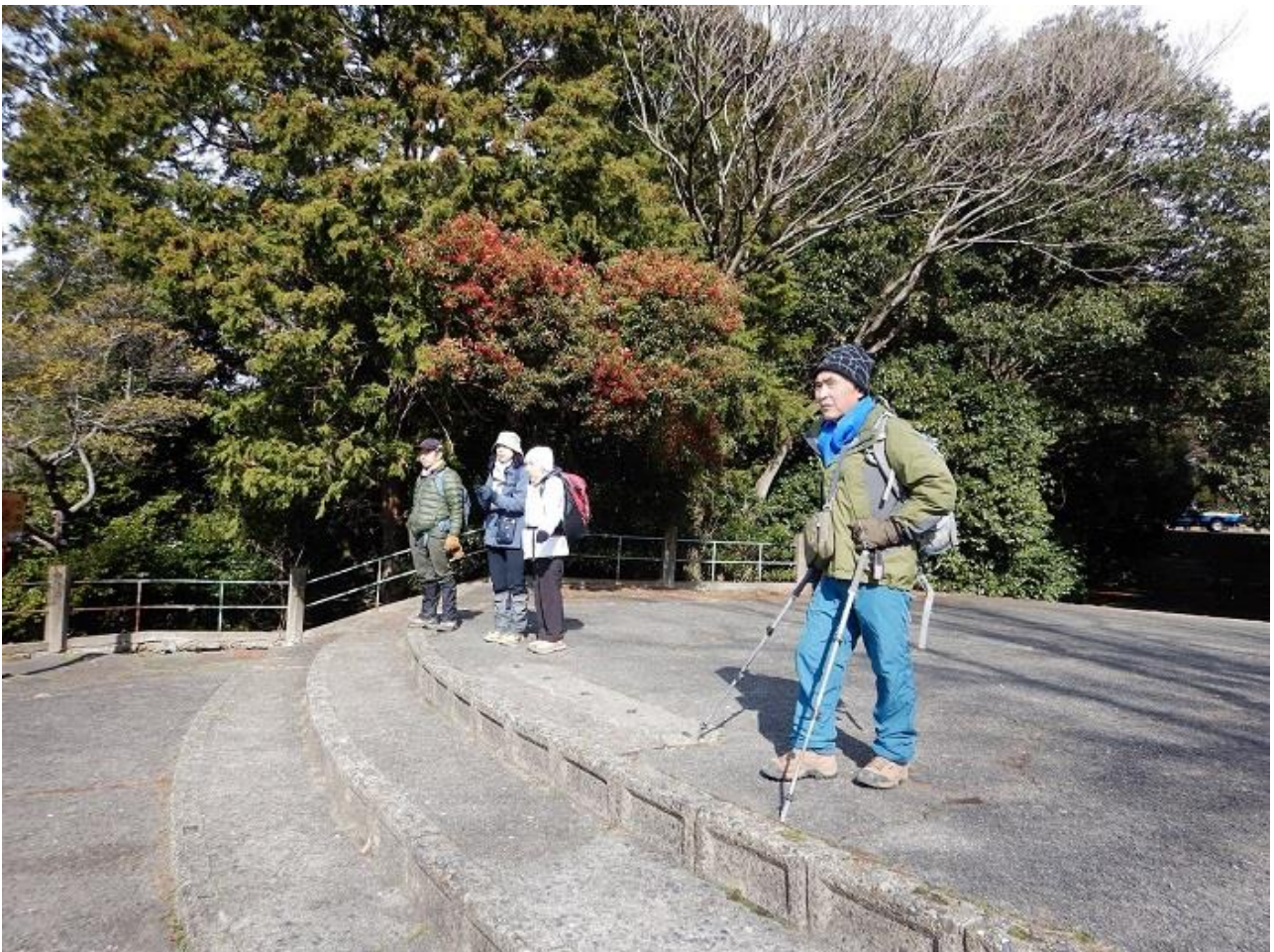
16, 東山山頂公園展望台から京都の町を見る