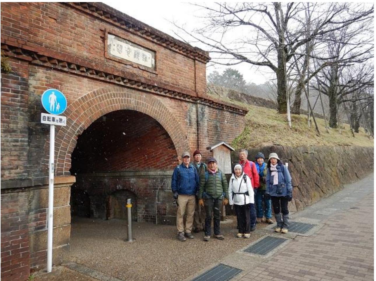
24, インクラインの「ねじりまんぼ」に到着。ここが今日のゴール。次回のスタート地点。