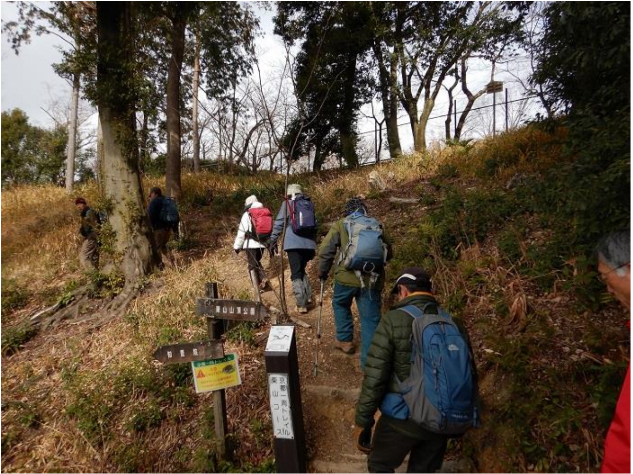
17, 将軍塚には行かず