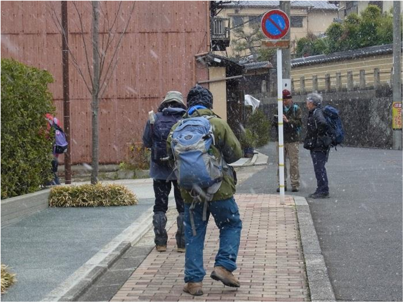
23, 栗田神社前で左に進み、三条通りに出る。