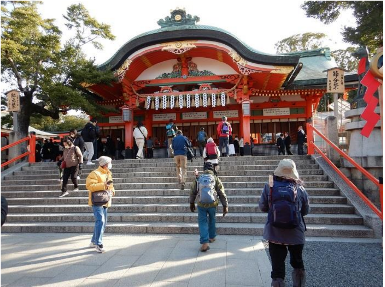
1, 伏見稲荷にお参りして