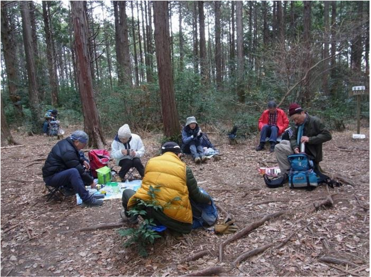
13, 清水山山頂でお弁当