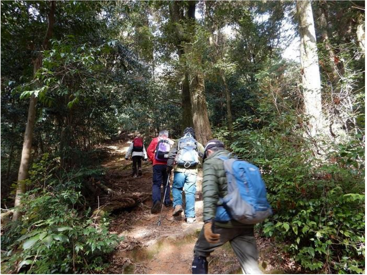
15, 東山山頂公園へ向かう