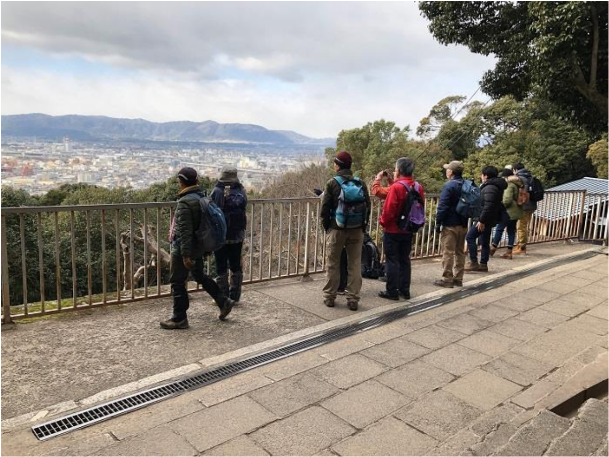
3, 展望台に着き、眺望を楽しむ。遠く MMC の本社ビルも見える