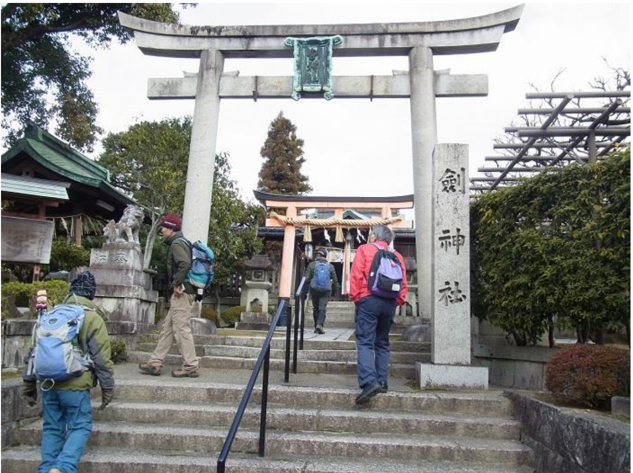
8, 剣神社に寄ってゆく