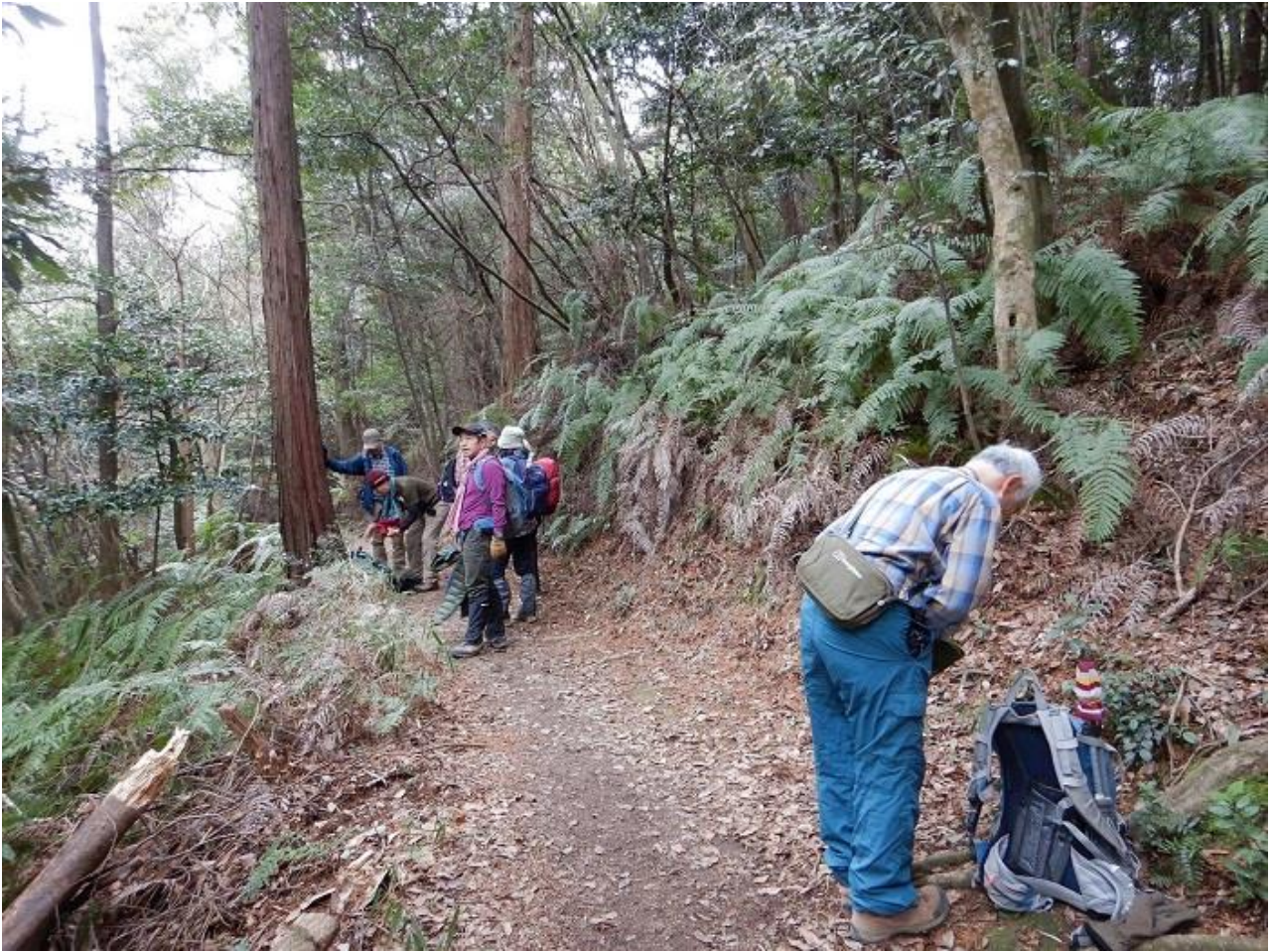
9, 東山山系を進む。新幹線のトンネルを少し越えたあたりで小休止。