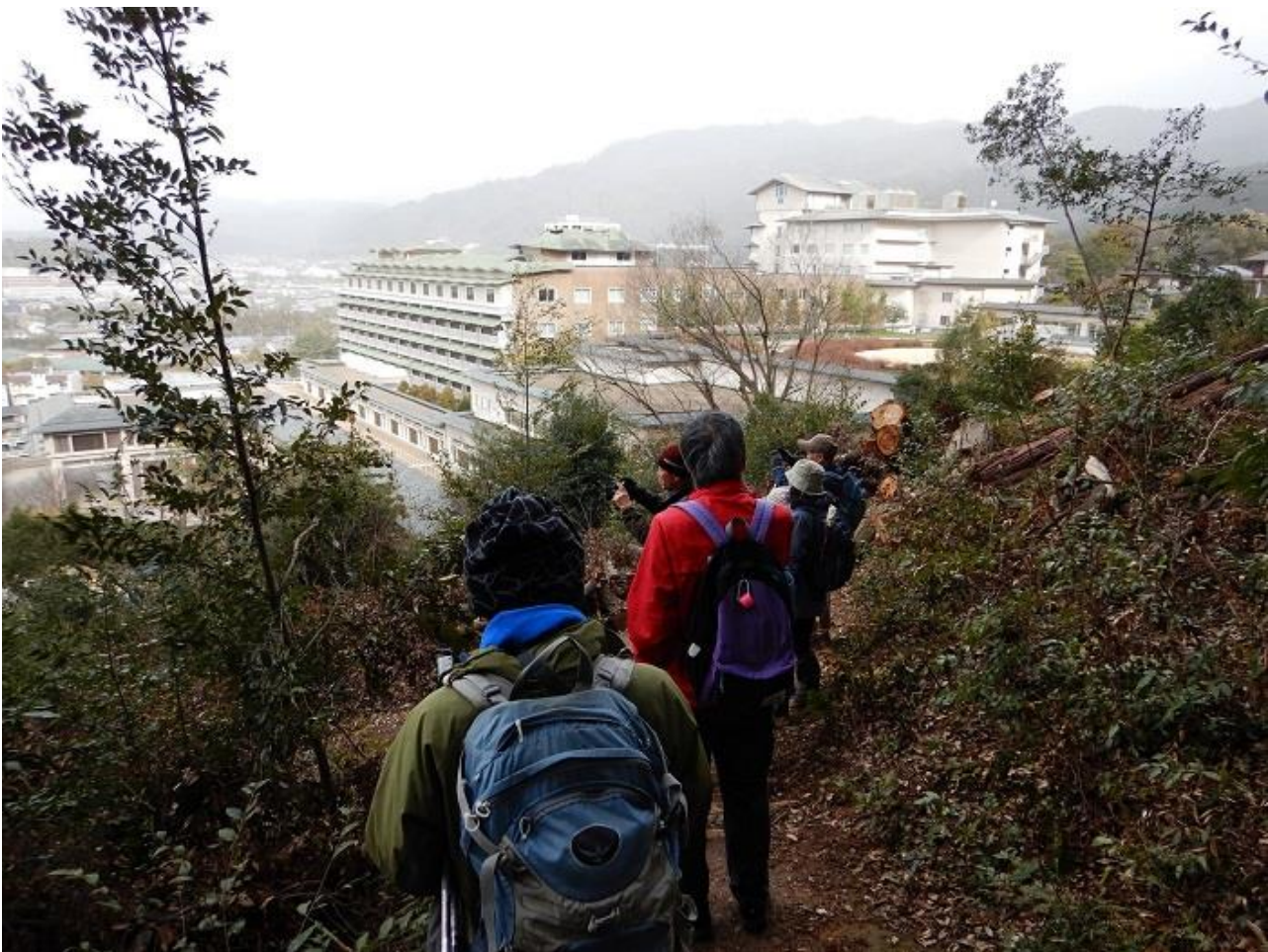
20, 都ホテル近くにくだる。昔はこんなに近くに下らず。ルートが少し変わったようだ。