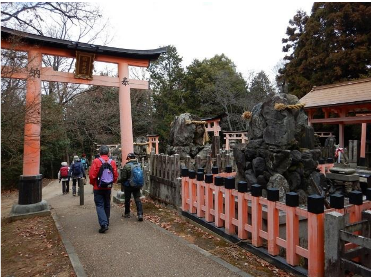
6, 四辻を後に北上。観光客はいない。