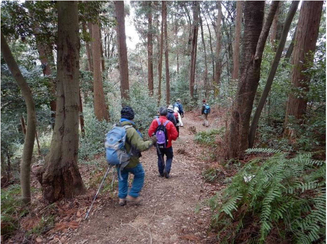
19, 栗田口に下ってゆく