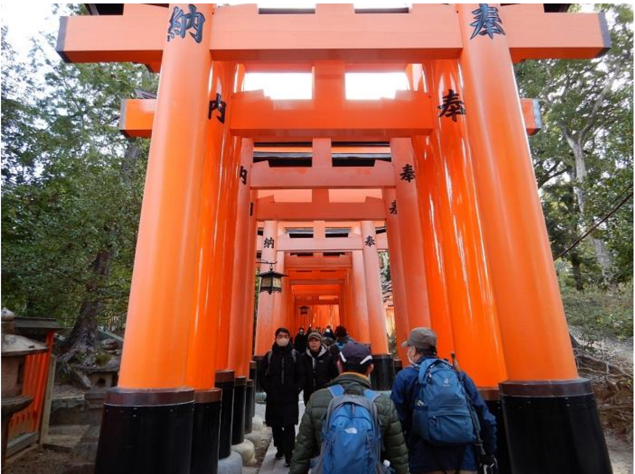
2, 連なった赤い鳥居の道を進む