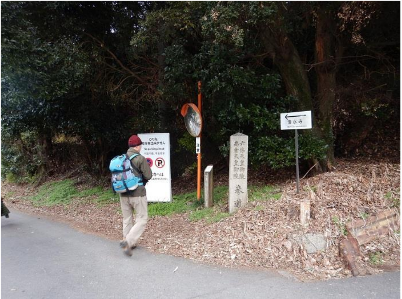
11, 1号線を渡り、清水山に上る。