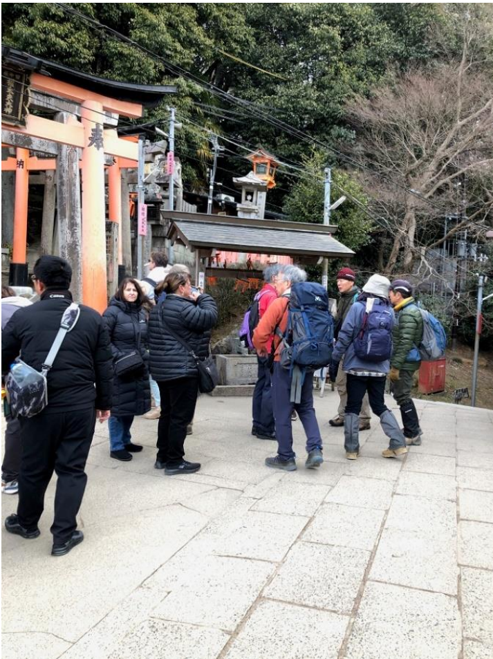
4, 四辻に到着。ここから進路を北にとる