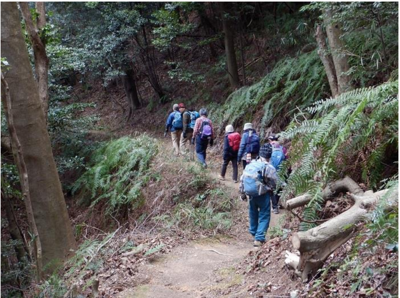
10, 国道1号線を目指す。