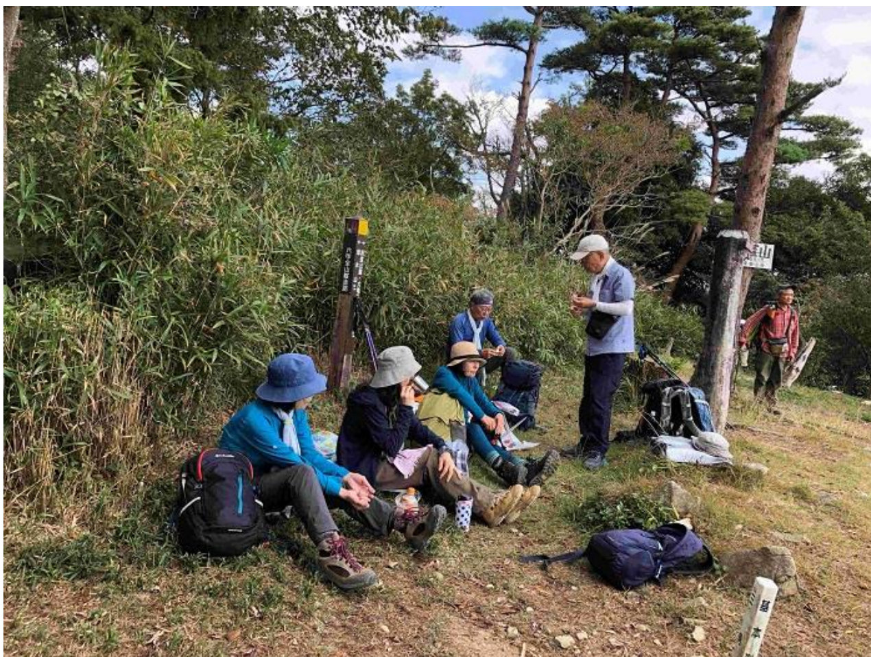
10, 鍋蓋山山頂でお弁当