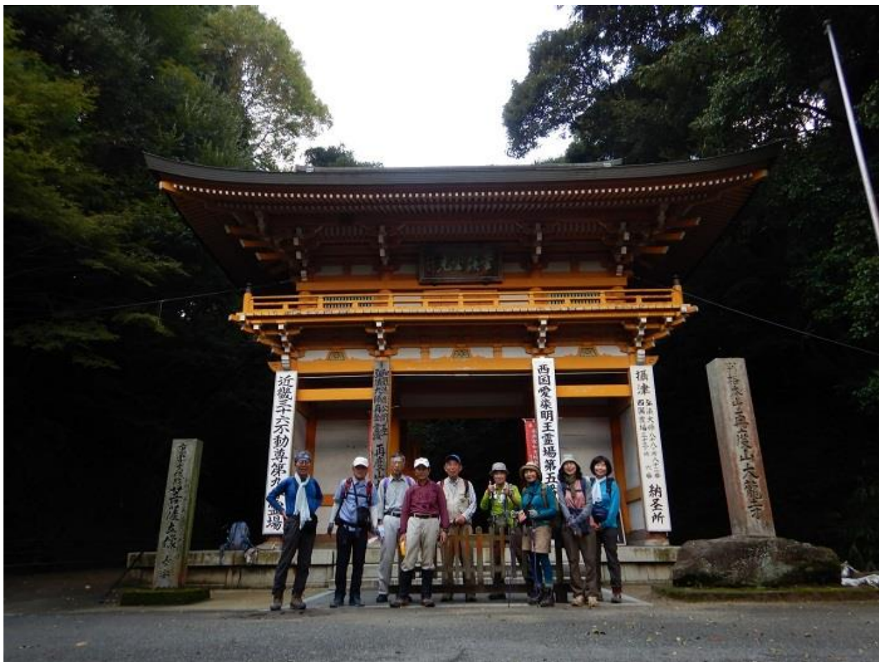
7, 大龍寺山門で全員、この後道を誤り、再びここへ戻り、左側の道を上る