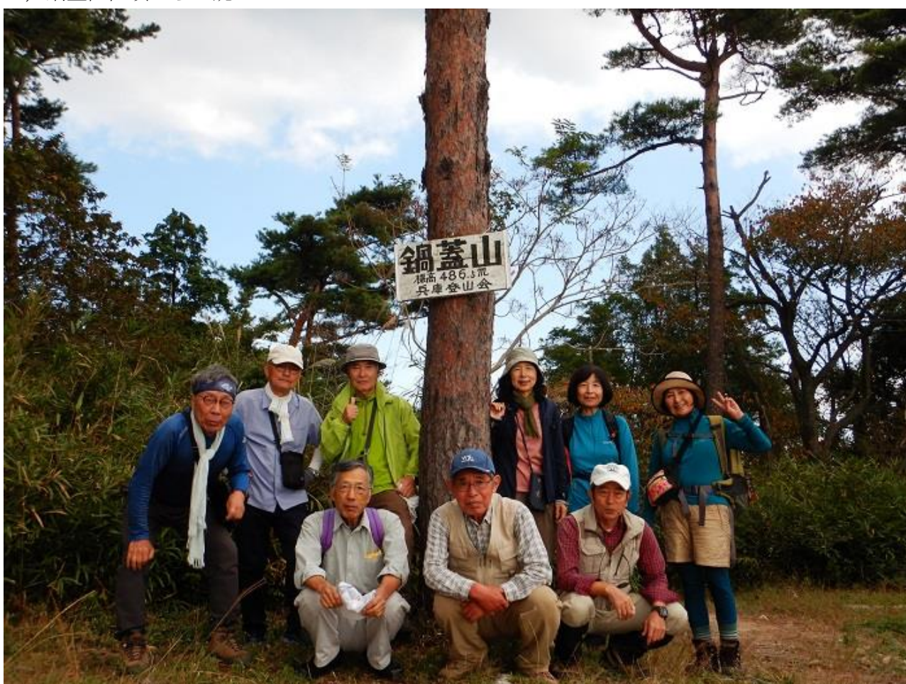
12, 鍋蓋山山頂で全員