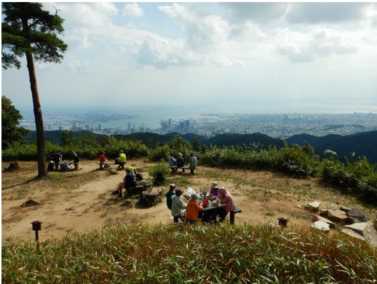
11, 鍋蓋山山頂からの眺め