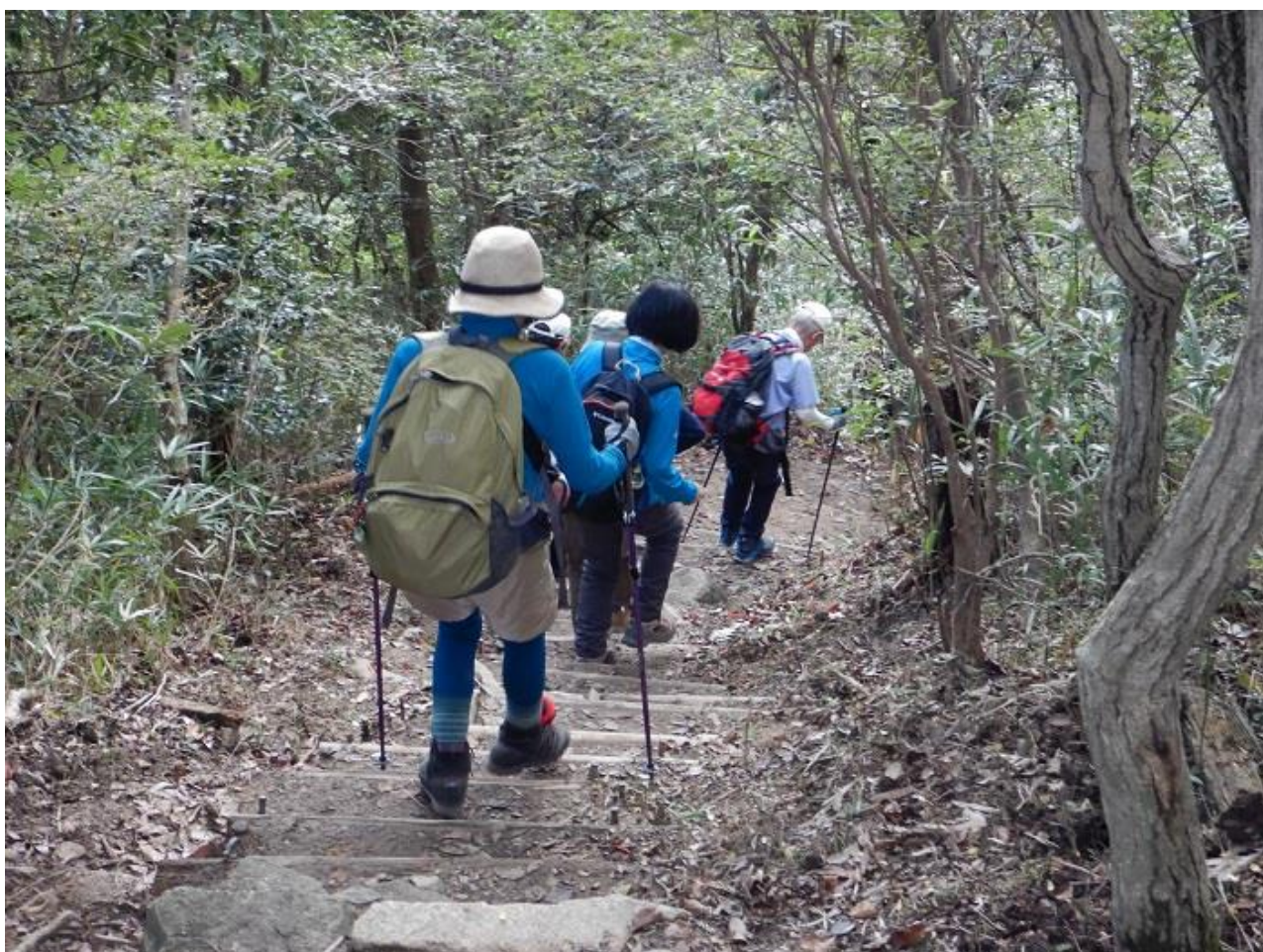
20, 鴨越駅を目指して下る