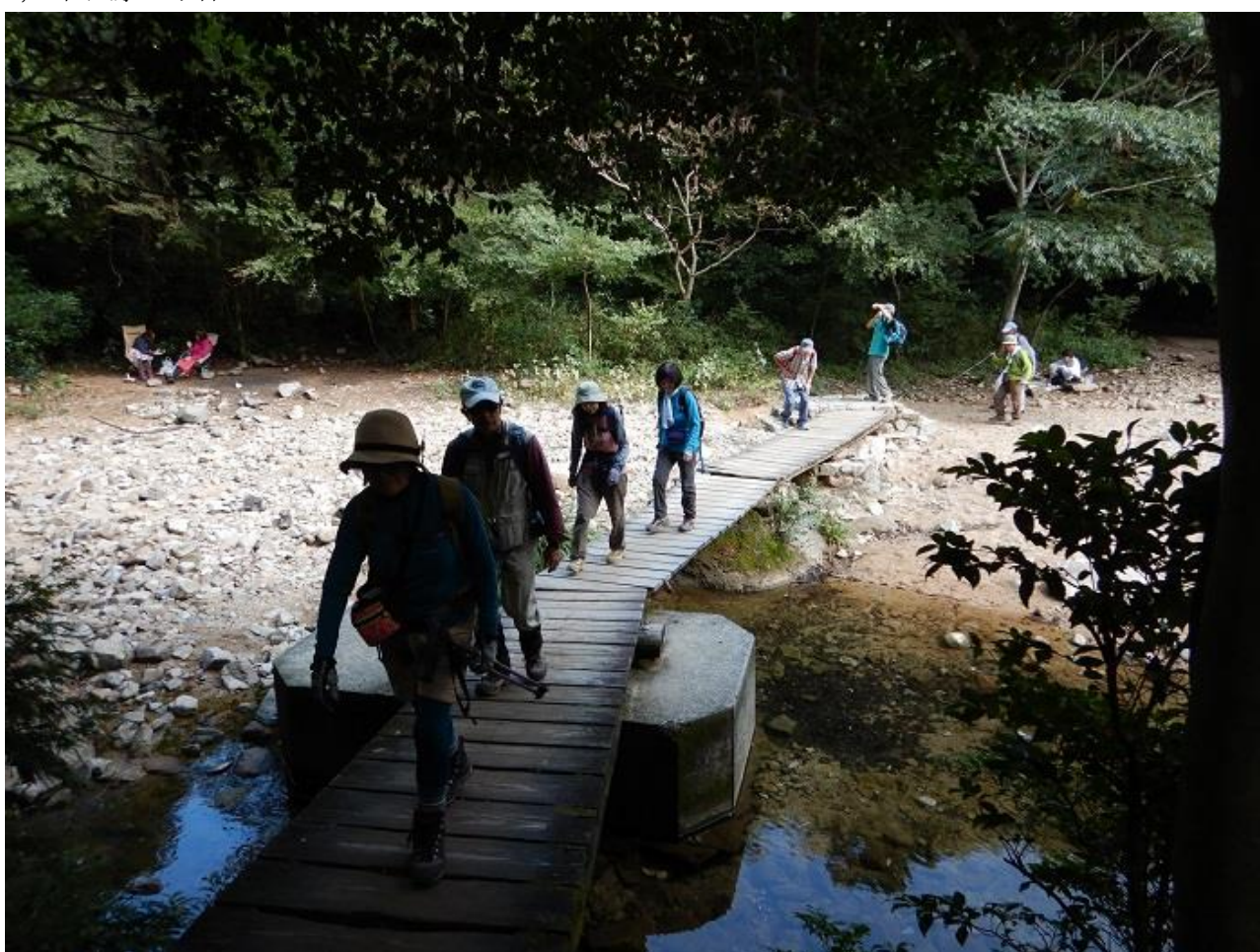
6, 橋を渡り、大龍寺山門を目指す