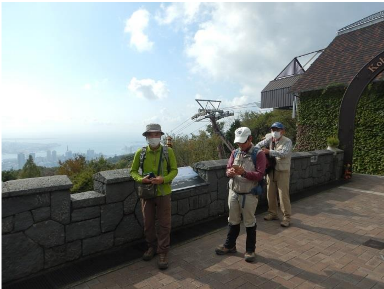
1, ロープウェイでハーブ園に