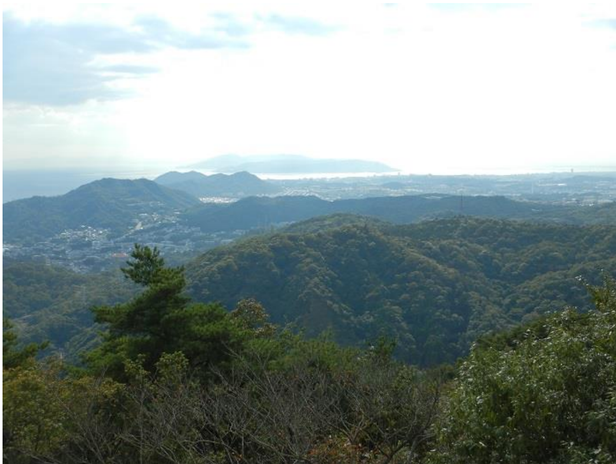
17, 菊水山展望台から淡路島を望む