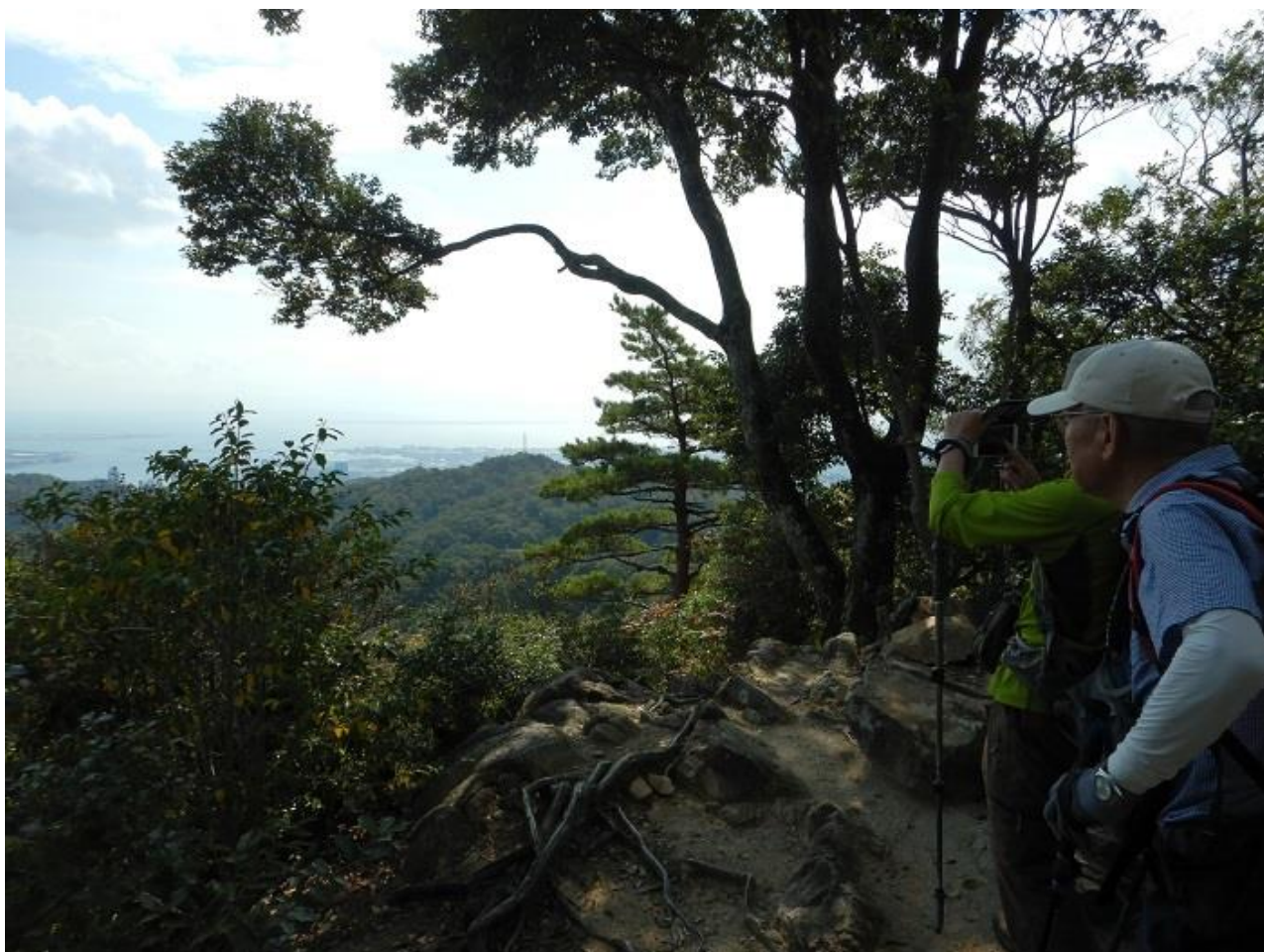
8, 鍋蓋山への途中、景色を眺める