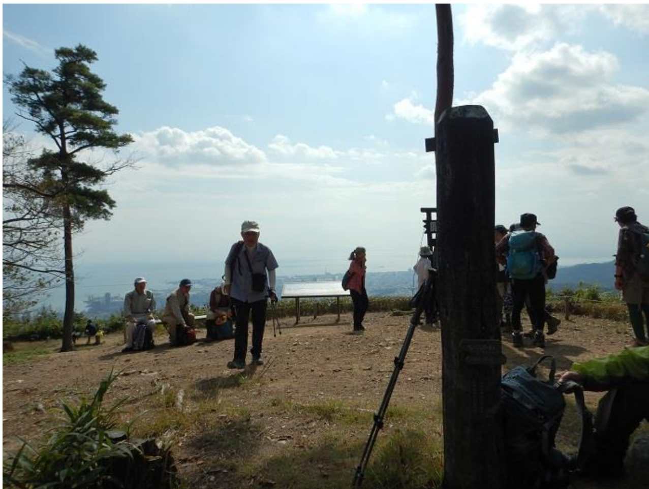
9, 鍋蓋山山頂に到着