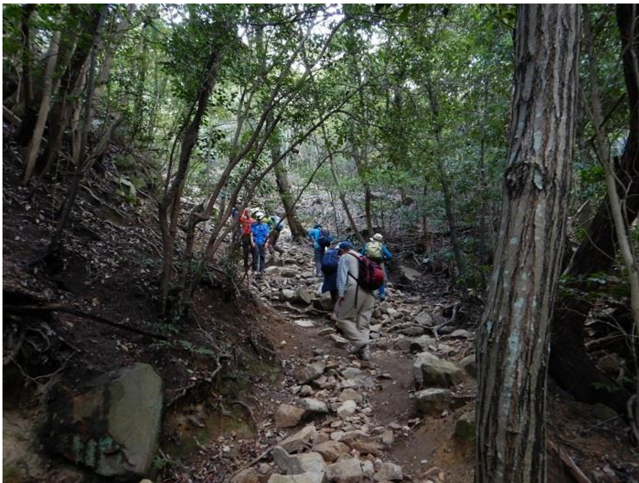
13, 天王吊橋を越えて菊水山に取りつく