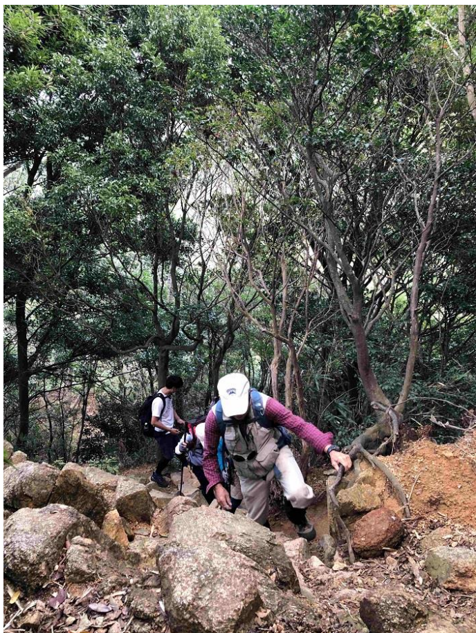
15, 菊水山へは急登となる