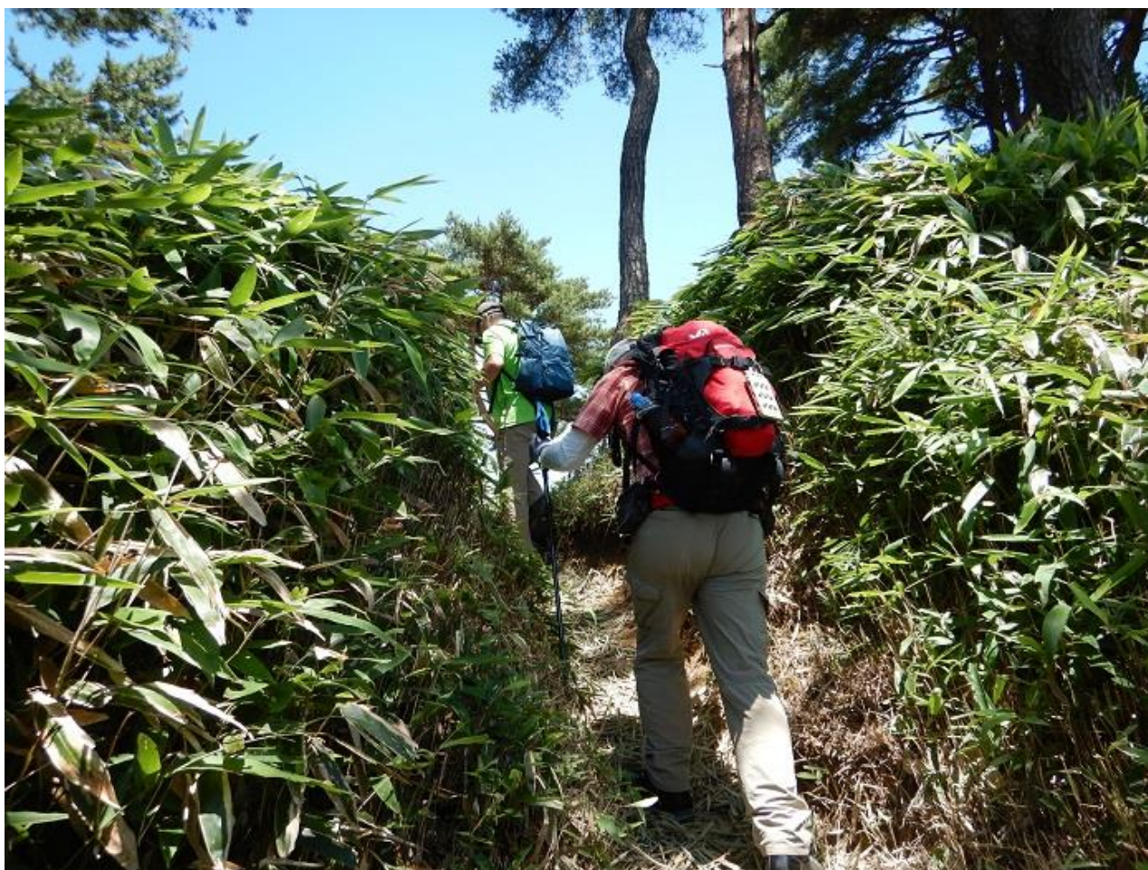
4, もうそこが石宝殿の駐車場