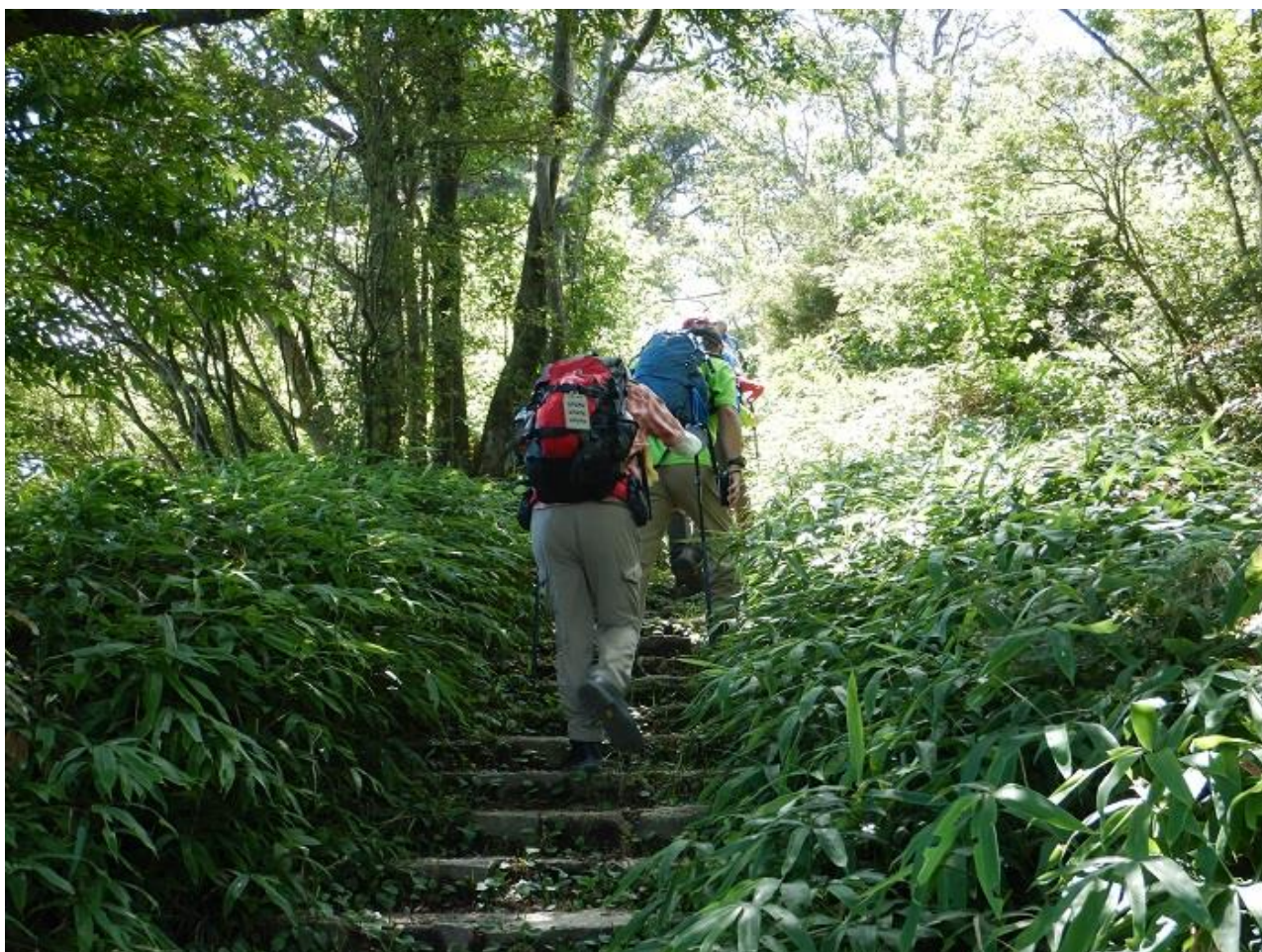
10, 小さなアップダウンが続く