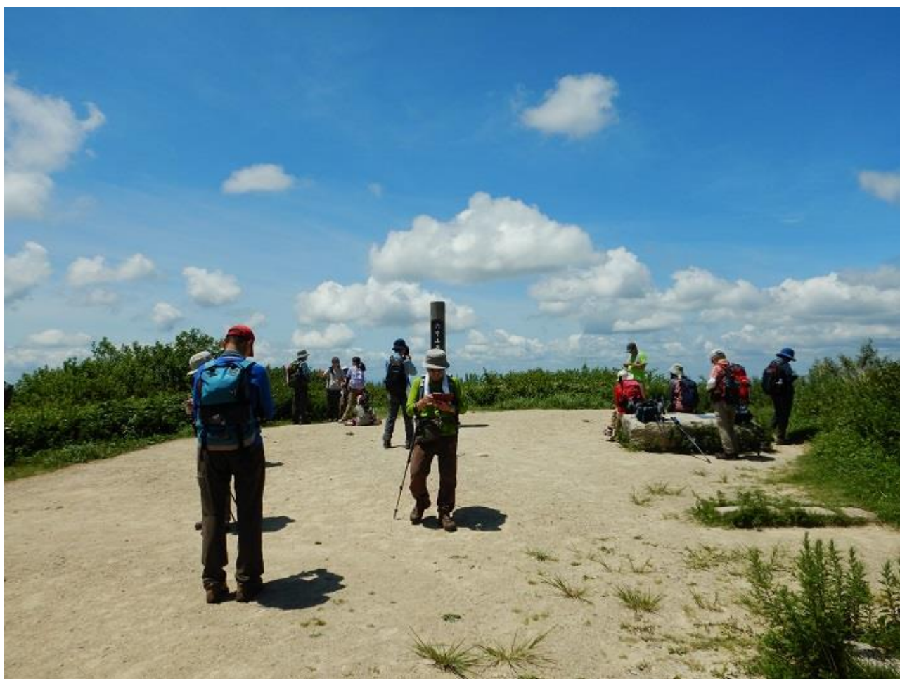
8, 最高峰で 360 度の展望を