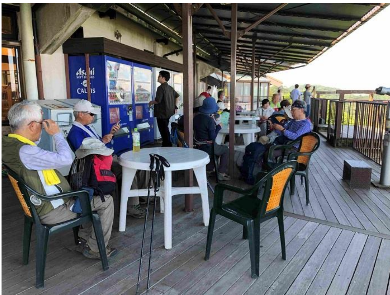
14, ガーデンテラスで休憩