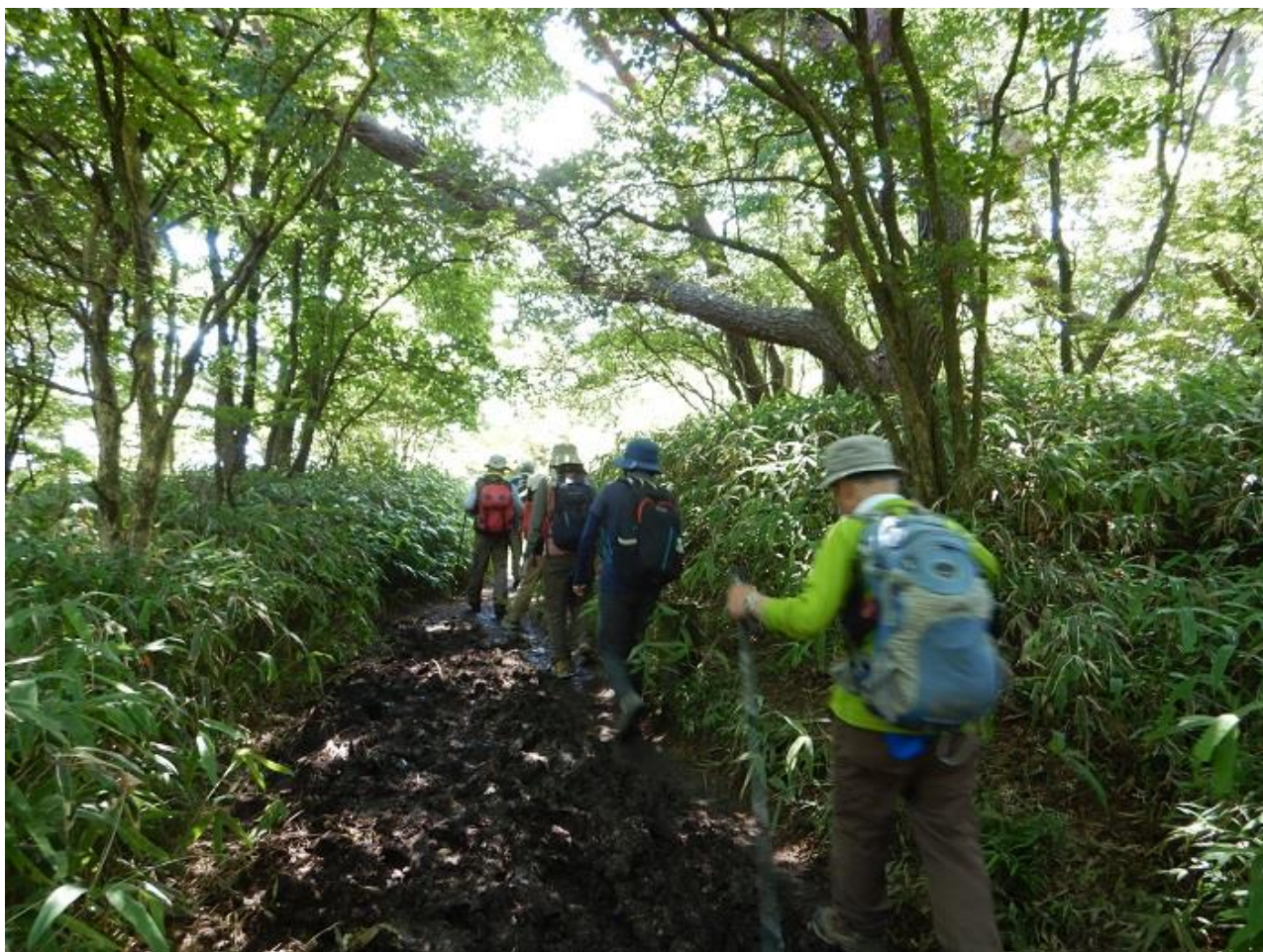
9, ガーデンテラスを目指す