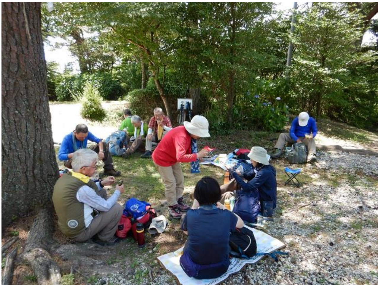
5, 石宝殿の木陰でお弁当、涼しい風が