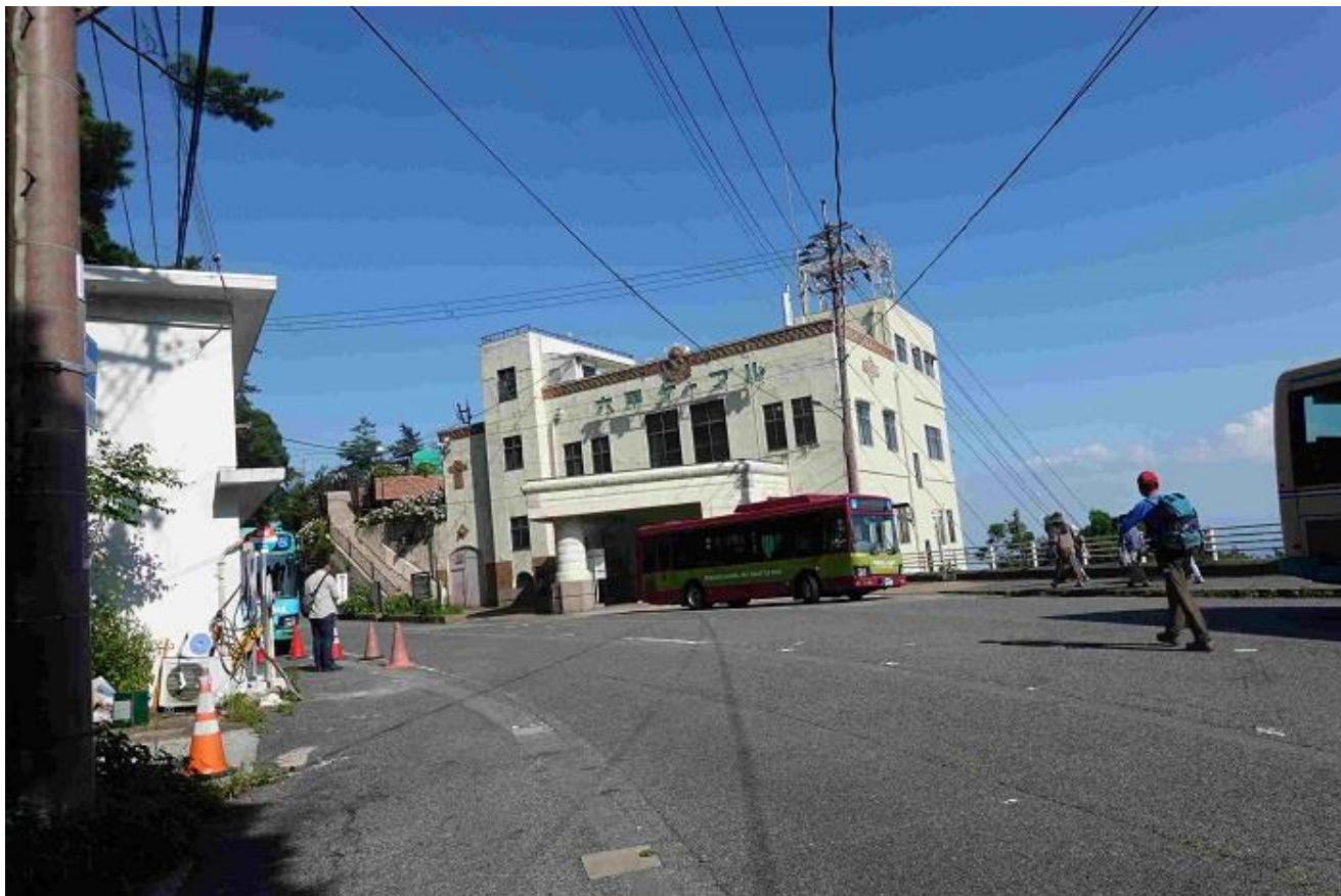
17, 六甲ケーブル上駅