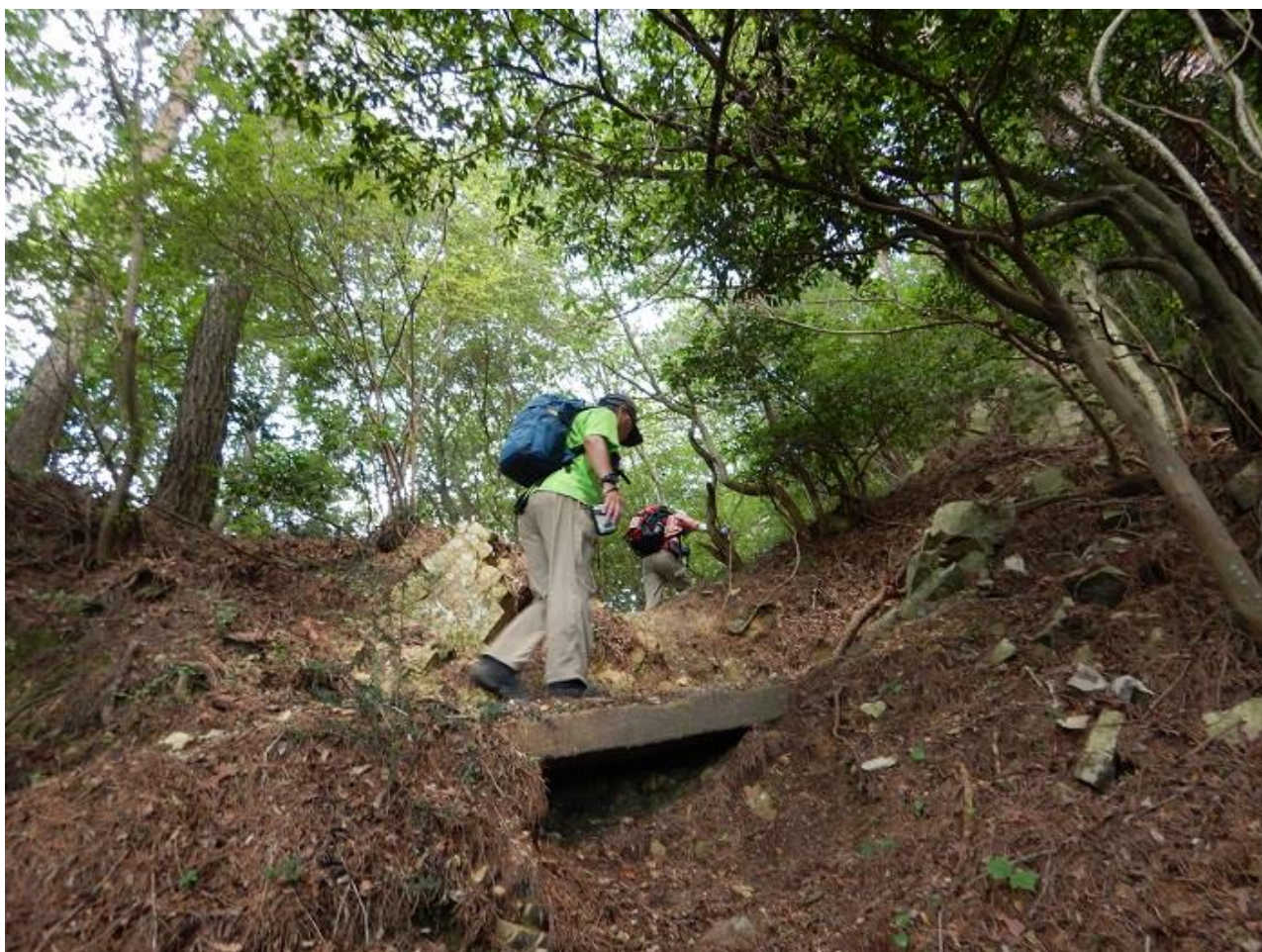
2、蛇谷北山への急登