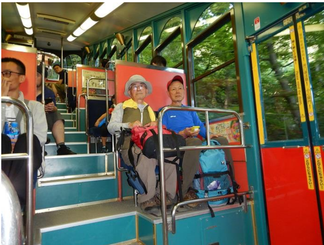
18, ケーブルで下るのは楽ちん