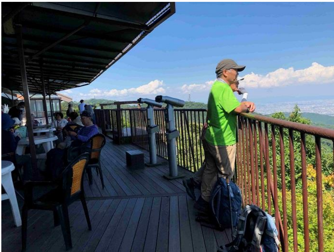
15, ガーデンテラスからの眺め良し