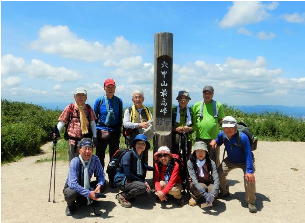
7, 六甲最高峰にて全員