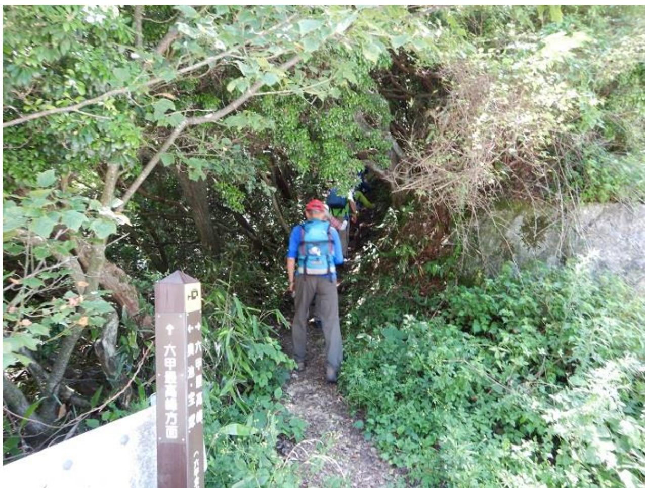
6, 六甲最高峰を目指す