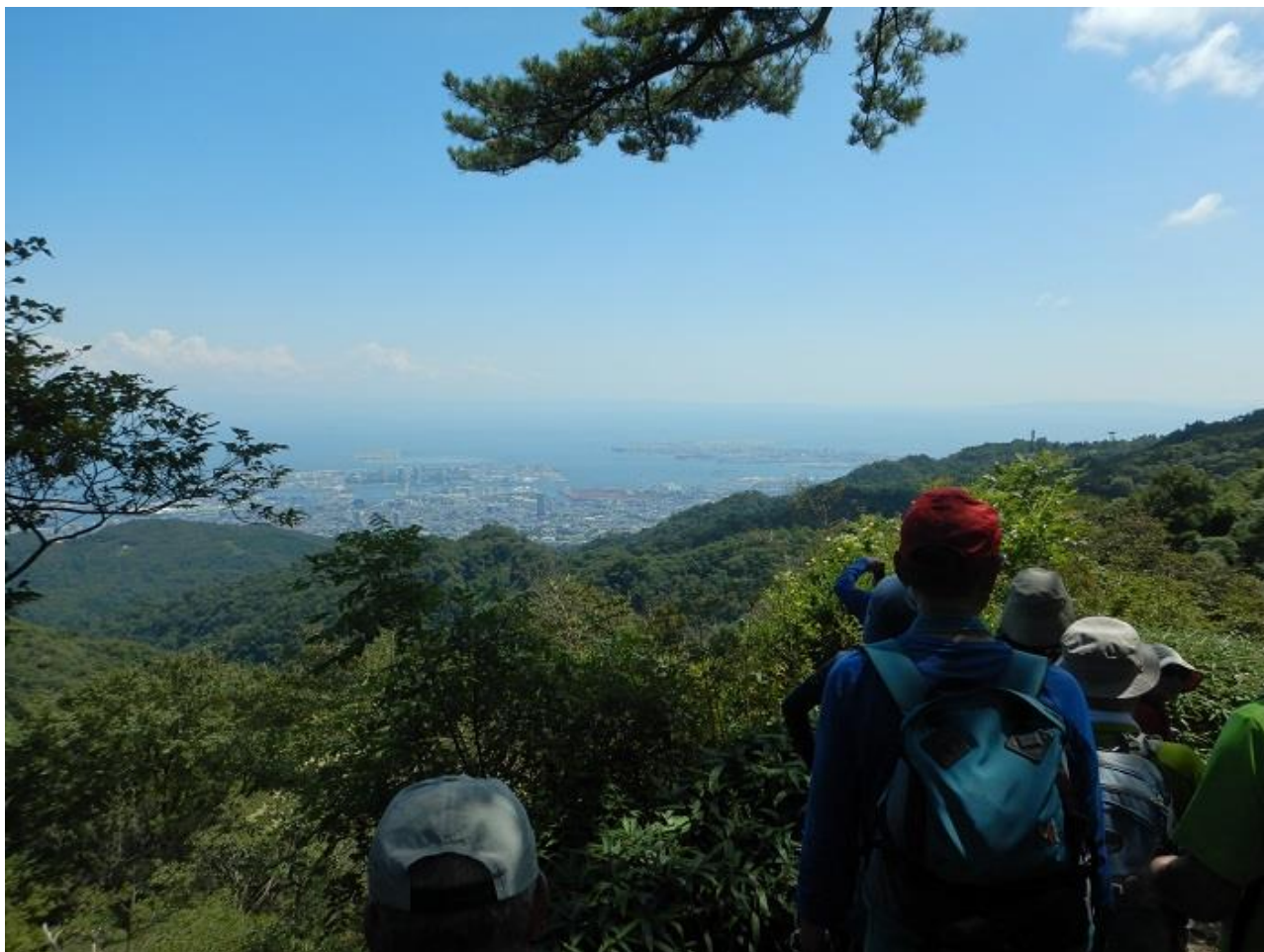
11, 所々で、展望を楽しむ