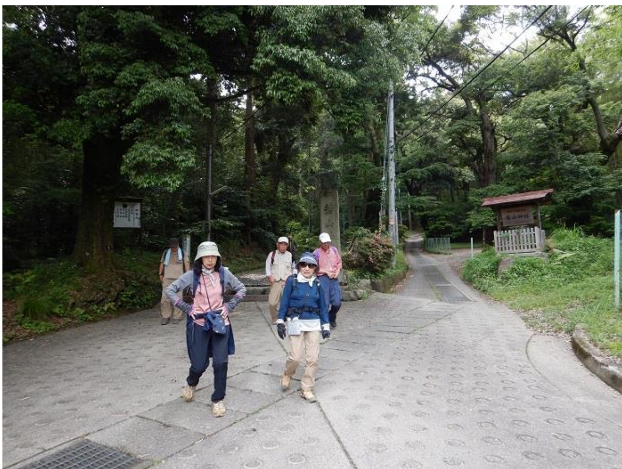
16, 若山神社を出て、若山台バス停に向かう