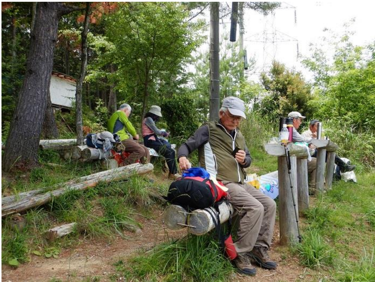
13, 三川合流ビューポイントでお弁当にする