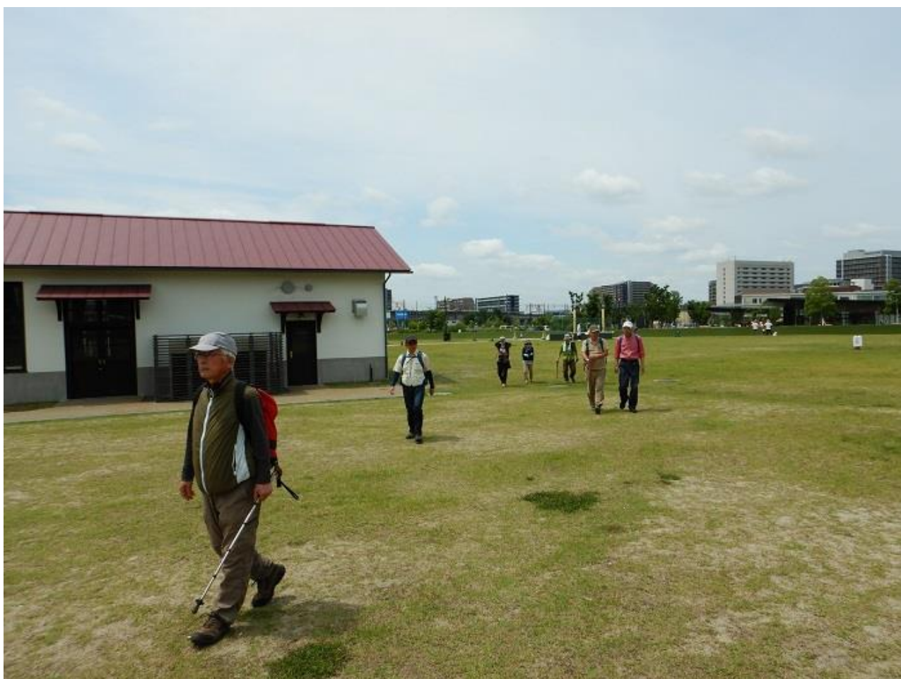
2, 安満遺跡公園を通り抜けて