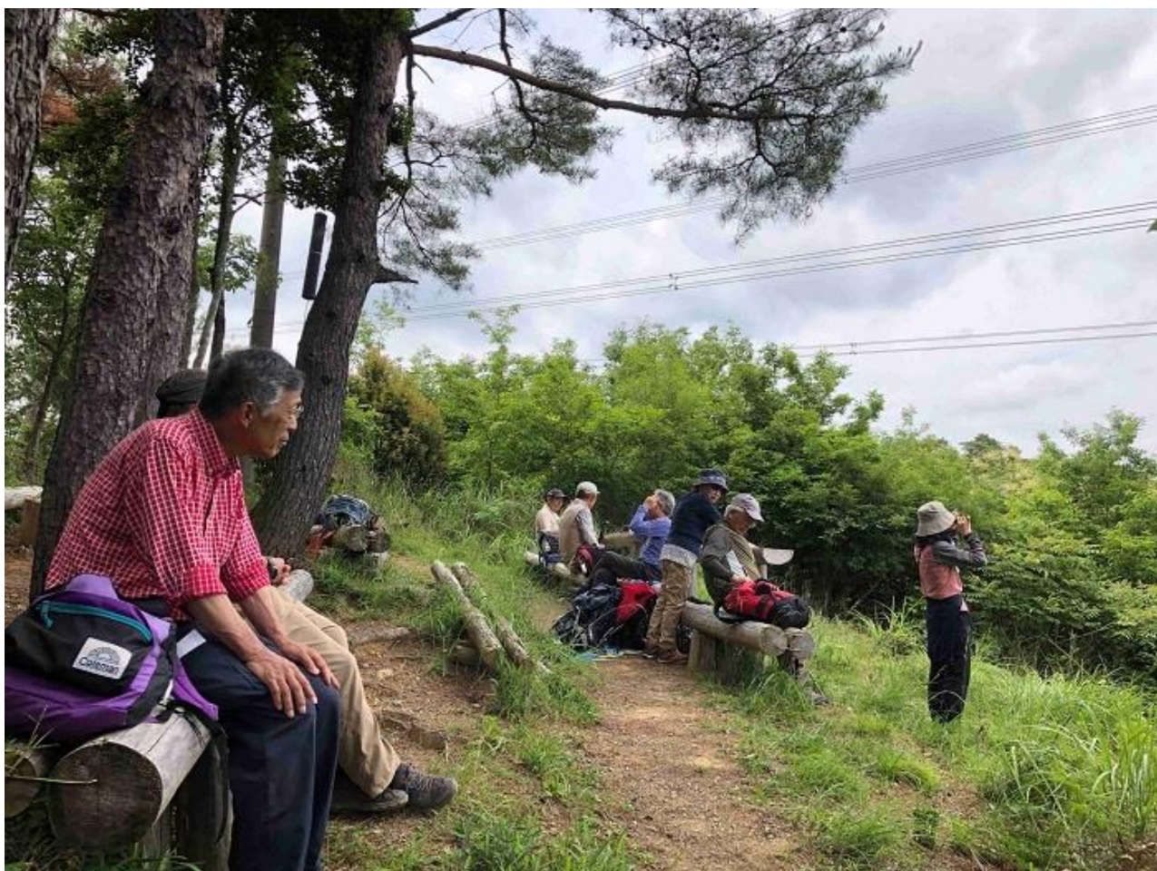
14, 三川合流ビューポイントでのんびり