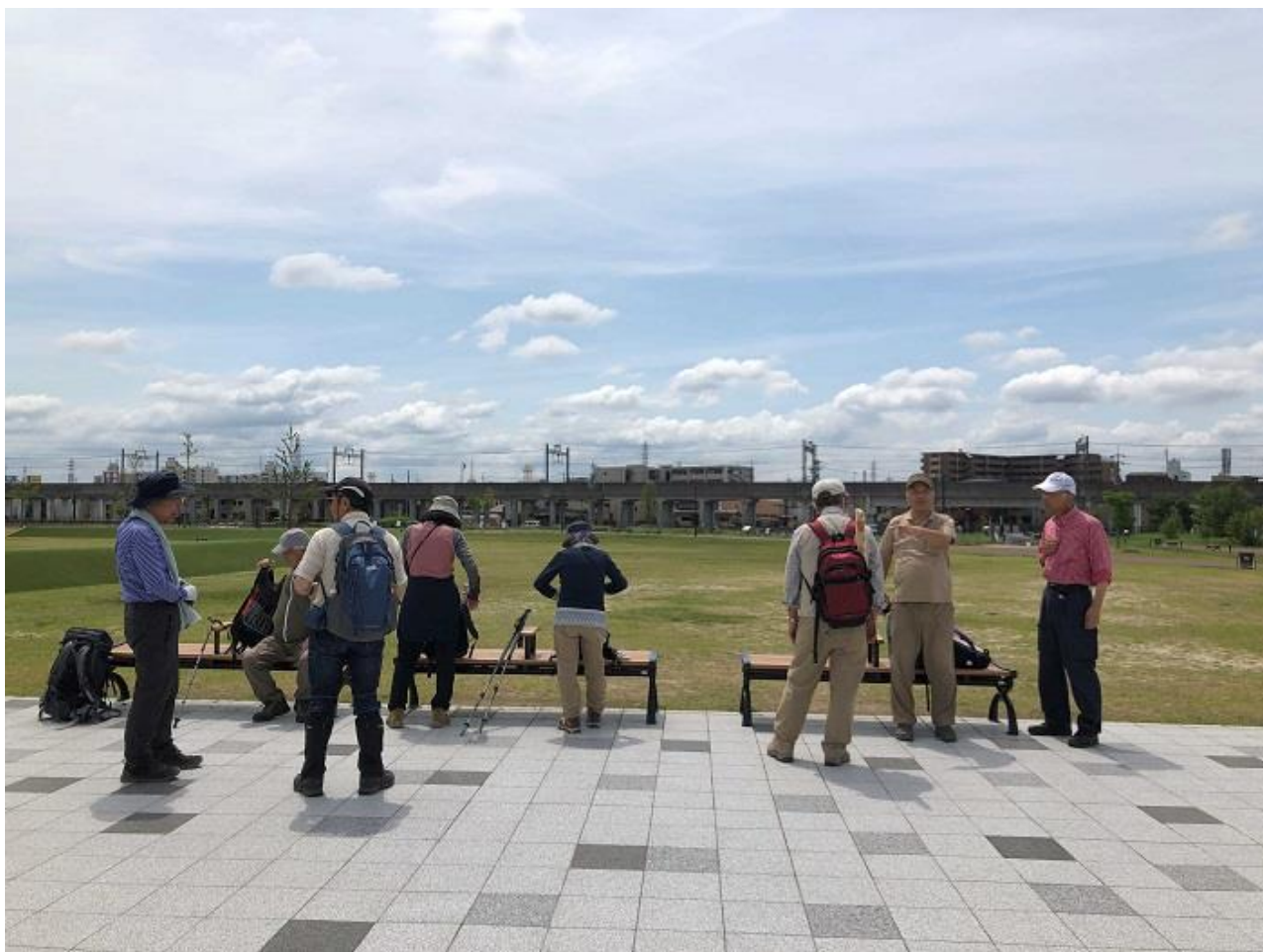
1, 元・京大農園、現・安満遺跡公園で全員集合