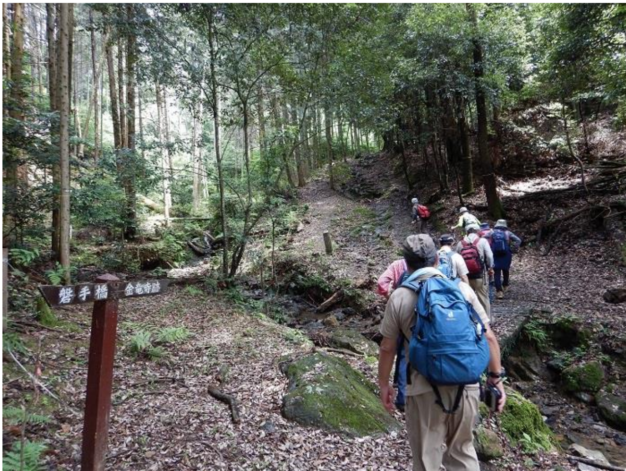
5, 金竜寺跡を目指して上る