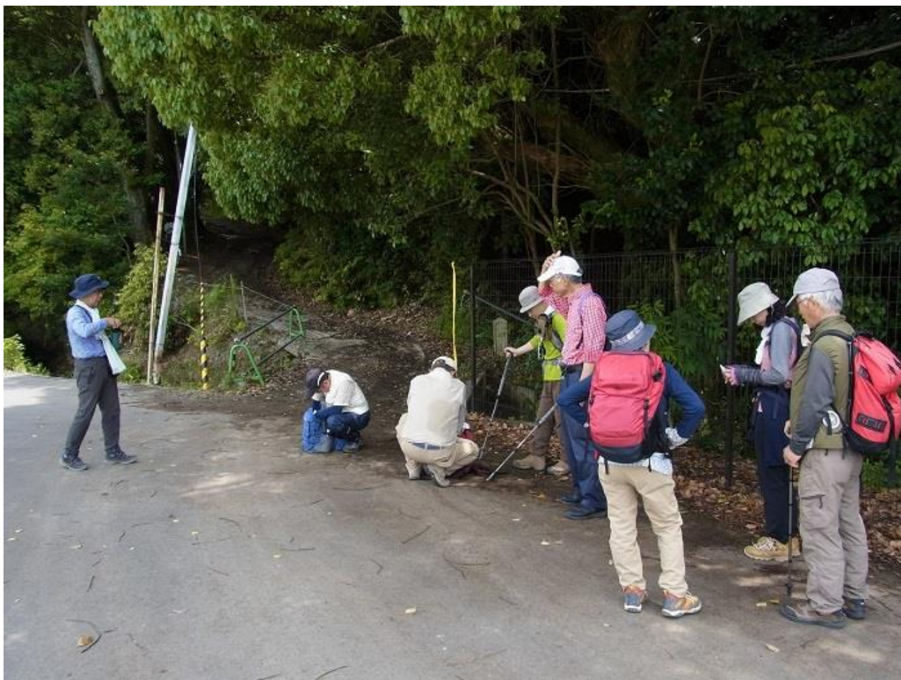
3, 病院裏の登山口で小休止