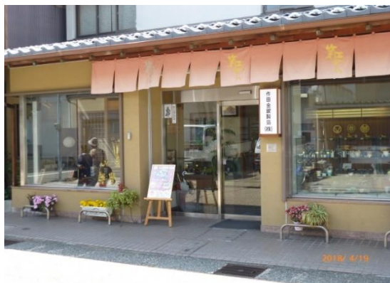
工芸さくだにて「金箔貼体験」