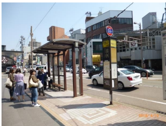
はこまち前より乗車、橋場にて下車