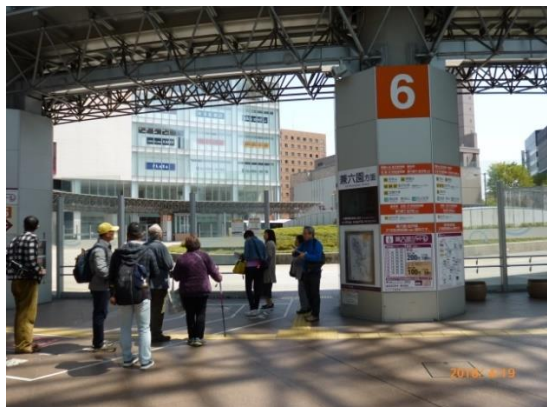
金沢駅東口6番：兼六園シャトル