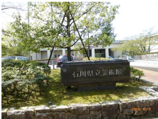
県立美術館・成巽閣下車：県立美術館